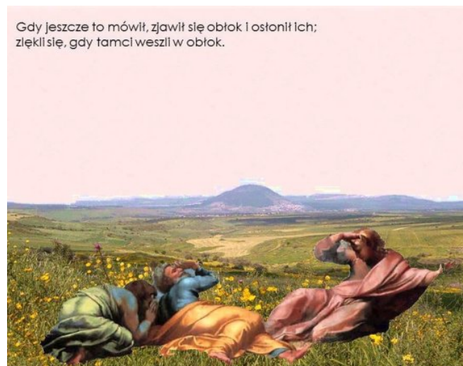
Gdy jeszcze to mówił, zjawił się obłok i ostonił ich; ziękli się, gdy tamci weszli w obłok.

Jezus pragnie również, aby doświadczenie przemiany stało się udziałem każdego z nas. Byśmy wszyscy przeżyli i zrozumieli to, co apostołowie. I dlatego proponuje nam wyjście w góry. Nie chodzi Mu o Tatry, Sudety czy Karkonosze. Ta święta Góra Przemienienia jest w każdym z nas. I dokonuje się w czasie Eucharystii i lektury Pisma św. Również dziś Pan pragnie nas przemieniać i posyłać do braci, którzy na nas czekają. Tylko przemienieni światłem Taboru możemy przemieniać świat. Tylko wtedy będziemy światłem świata