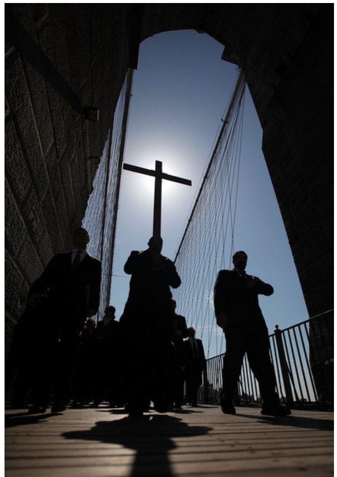
The 23rd Way of the Cross over the Brooklyn Bridge — GOOD FRIDAY 2018 —

public in the fourth century, a way was marked out. It was changed a few times over the years, and today's usual route was sketched by the Franciscans six hundred years ago, although Anglicans and Byzantines have their own unique detours. Friday is the most favored day, although it is crowded then. Almost everyone begins at the Lion's Gate in the Muslim Quarter, and ends at the Church of the Holy Sepulchre. It's less than a quarter mile, but it threads its way through crowded markets with souvenir shops and fast-food snacks. There are, just as in your parish church, fourteen stations along the way. The exact spots are not known, but what matters is the pilgrim's unique ability to see even an ordinary road in a teeming city as something more than meets the eye.