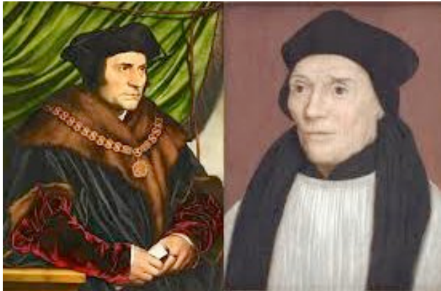
SAINT JOHN FISHER (1469-1535) AND SAINT THOMAS MORE (1477-1535) June 22

John challenges us Christians to the fundamental attitude of Christianity—total dependence on the Father, in Christ. Except for the Mother of God, no one had a higher function in the unfolding of salvation. Yet the least in the kingdom, Jesus said, is greater than he, for the pure gift that the Father gives. The attractiveness as well as the austerity of John, his fierce courage in denouncing evil—all stem from his fundamental and total placing of his life within the will of God.