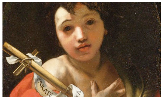
THE NATIVITY OF SAINT JOHN THE BAPTIST SAINT OF THE DAY FOR JUNE 2

Remember, though, Jesus seldom heals without some sort of action on our part. When you have given your concern over to God, other concrete steps may be necessary. Is it time to schedule an appointment with a professional? Time to name an issue? Or time for the sacrament of reconciliation? Evil's power comes from remaining in the darkness. When we no longer close ourselves off or suffer alone but share our concerns with someone, we can begin to grow and heal and move past them. It is seldom magical or instantaneous. It is a long arduous process. But we hold on to the simple reminder, "You are worth more than many sparrows!"