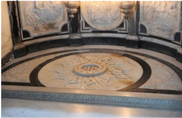
Miejsce narodzenia św. Jana Chrzciciela w Ain Karim

podczas zwiastowania Najświętszej Maryi Pannie. W istocie poprzez swoją matkę Elżbietę Jan był krewnym Pana Jezusa. To jego Bóg powołał, by przygotował drogę na przyjście Mesjasza.