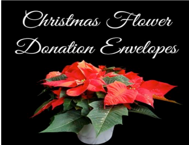
Christmas Flower's - $1,360