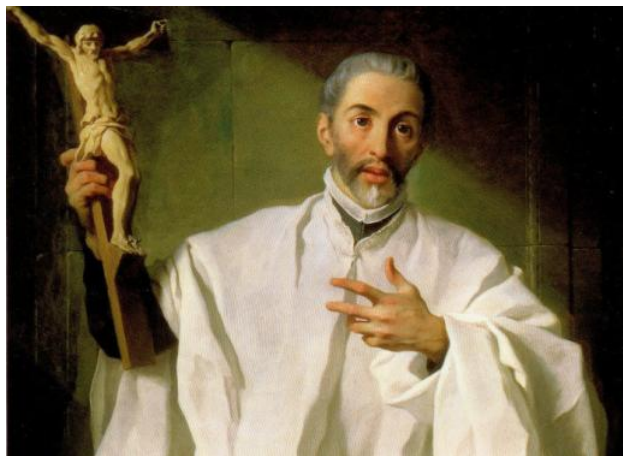
SAINT JOHN OF AVILA Saint of the Day for May 9 (c. 1500 – May 10, 1569)