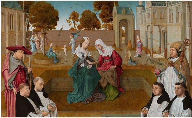
Memorial Tablet | Master of the Spes Nostra

This is a fairly late feast, going back only to the 13th or 14th century. It was established widely throughout the Church to pray for unity. The present date of celebration was set in 1969, in order to follow the Annunciation of the Lord and precede the Nativity of Saint John the Baptist.