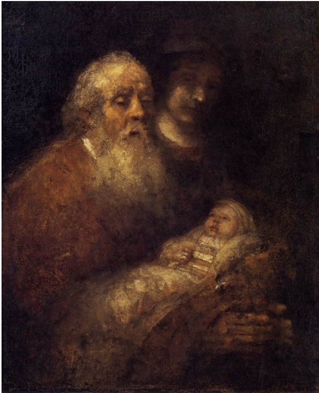
Circumcision by Rembrandt Van Rijn

Simeon recognizes the infant Jesus as the promised Messiah.